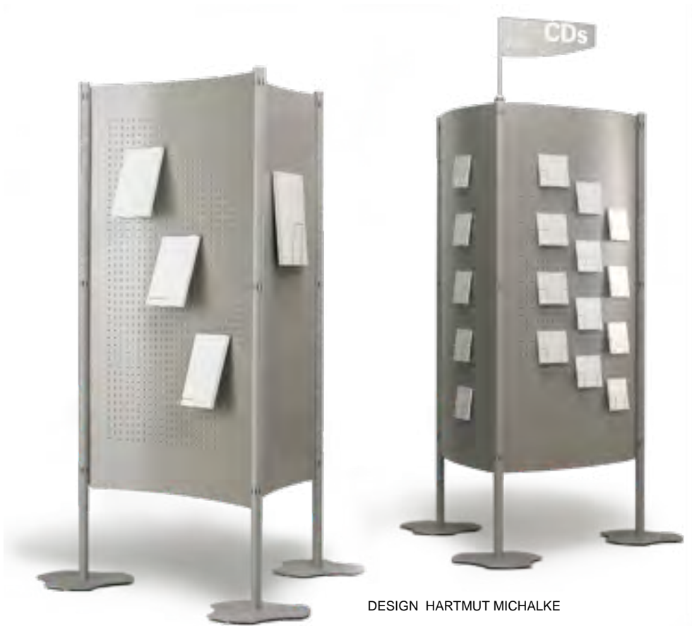
DESIGN HARTMUT MICHALKE