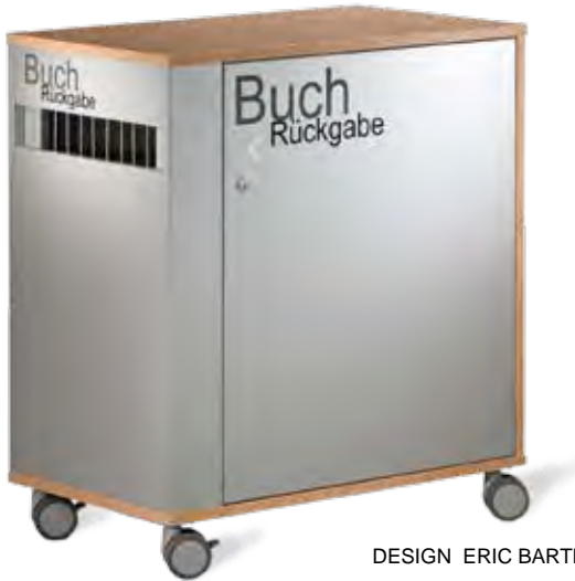
DESIGN ERIC BARTH