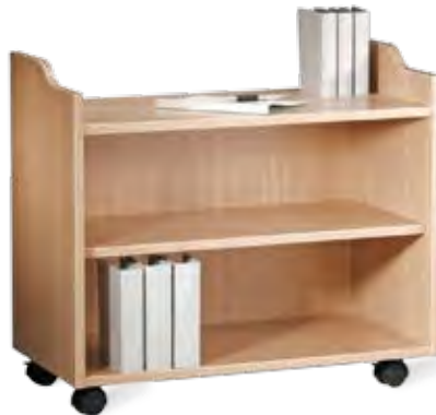
Beistellwagen, WA 3 nach vorne offene Ausführung

Beistellwagen, WA 3 und WA 4 Korpus und ein verstellbarer Einlegeboden 1 2 3 Holz furniert/kunststoffbeschichtet, 4 Rollen Ø 50 mm, 2 davon mit Feststeller. B 400 mm, H 650 mm, L 750 mm