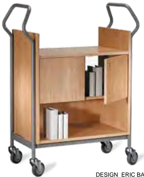
DESIGN ERIC BARTH

Arbeitsplatzwagen mit Ergo-Griff, WA 1 mit Schrankensatz für Ordnerhöhe. Einseitig verschließbare Drehtüren, transparente Rückwand aus Acrylglas. Schrankkorpus und Türen Holz furniert/kunststoffbeschichtet, 1 2 3 Gestell Metall lackiert. ● Türschloss verschieden schließend. 4 Rollen Ø 100 mm, B 460 mm, H 1145 mm, L 890 mm Einstellhöhe 350 mm