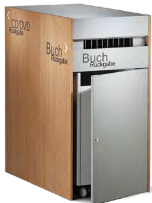
DESIGN ERIC BARTH