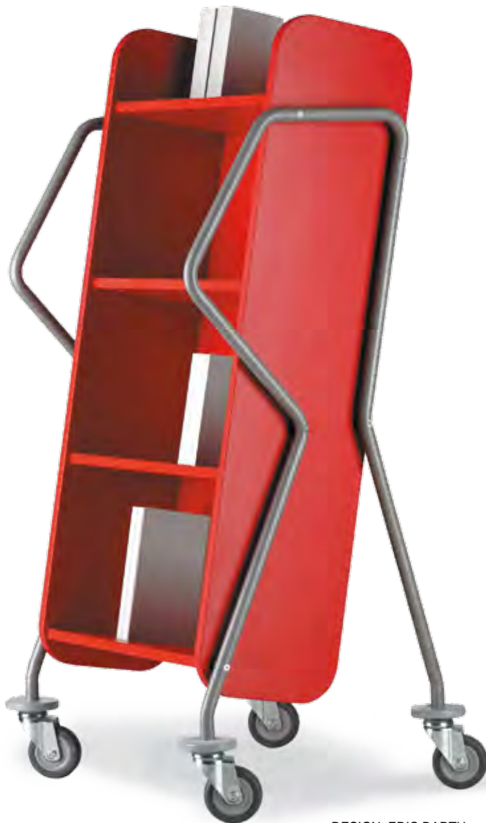
DESIGN ERIC BARTH

Ergonomisches Bücherwagenkonzept mit seitlichen Griffbügeln zur Variation der Greifhöhe unterschiedlich großer Mitarbeiter. Durch den schräggestellten Korpus ist ein sicherer Stand der Medien auf 4 Ebenen in bedienungsfreundlicher Arbeitshöhe gewährleistet. Die Medien stehen übersichtlich zum Mitarbeiter und können leicht nach links und rechts in die Regale einsortiert werden. Außer dem Buchtransport bietet sich eine Nutzung als Präsentationswagen an. Zur Beschriftung ist ein zusätzliches Aufsteckschild erhältlich.