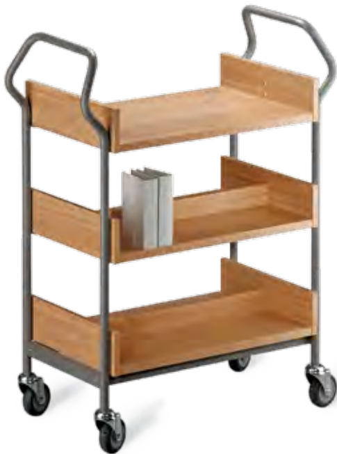
DESIGN ERIC BARTH