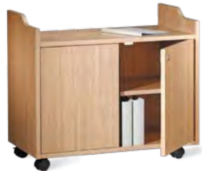
Beistellwagen mit verschließbaren Türen, WA 4 Schloss verschieden schließend